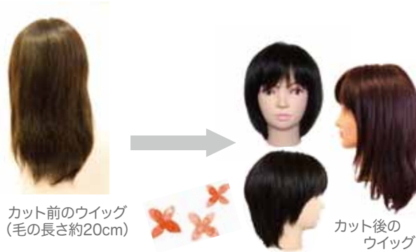
カット前のウィッグ (毛の長さ約20cm)

頭頂部は自然な肌色ネットを使った人毛100%の 手植えウィッグ。サイズ調整できるアジャスター付き、 毛髪が生えてくるまで使えます。 見た目の自然さと長く使える耐久性を考えました。